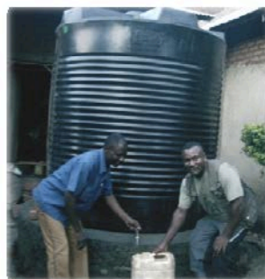
Rain water gutters connection to the water tank