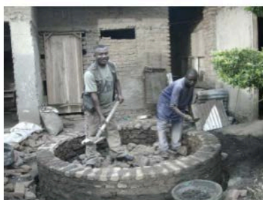
Base and water tank installation